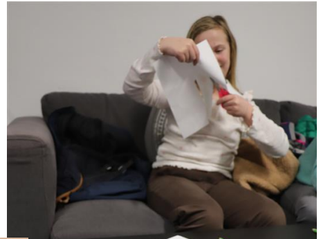
TRICKFILMPROJEKT DES MEDIENZENTRUMS