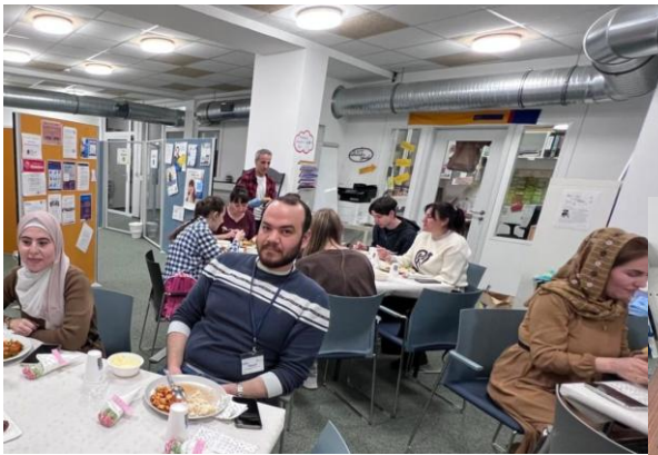
FASTENBRECHEN DER KONVERSATIONSGRUPPE