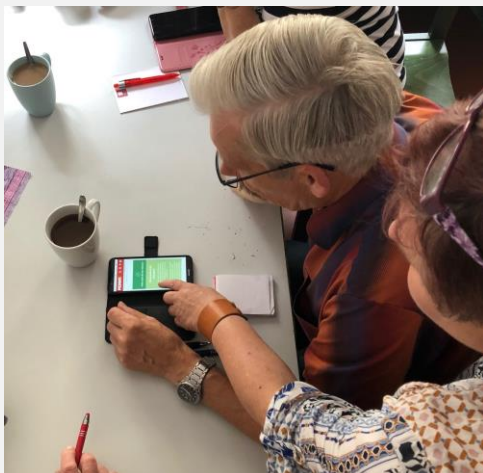
Foto: Handysprechstunde im MGH Schweinfurt 2019